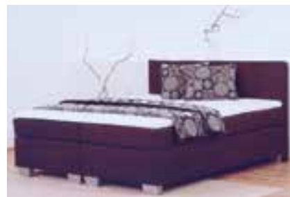
Boxspringbett – versch. Größen und Ausführungen

Öffnungszeiten: Montag bis Freitag 10:00–18:00 Uhr, Samstag 10:00–12:00 Uhr