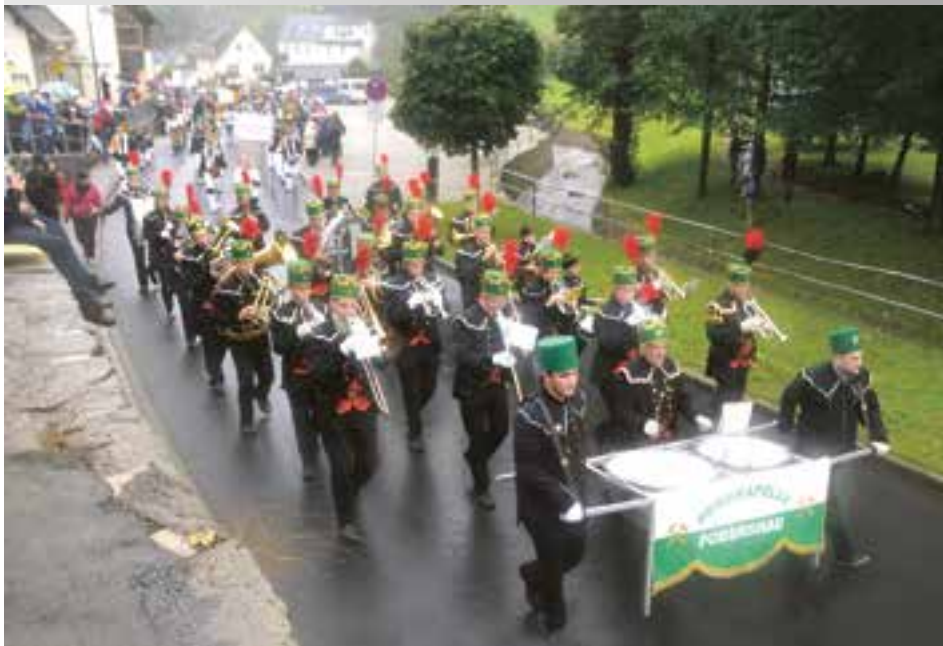
Große Bergparade am 14. September 2014 in Pobershau

Freuen Sie sich auf den Rückblick zur Festwoche in der nächsten Ausgabe am 9. Oktober 2014!