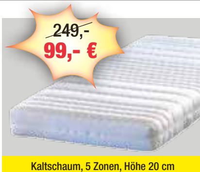
Kaltschaum, 5 Zonen, Höhe 20 cm

Äußere Annaberger Str. 11 • 09496 Marienberg Telefon: 03735 6607290 • Fax 03735 6607292 E-Mail: info@ihr-moebelpartner.de